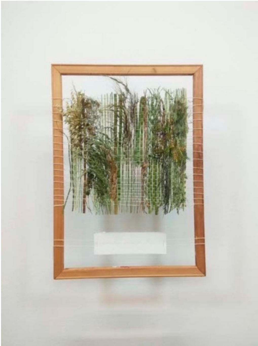
Pieza N°2 - Tejido en telar con pastos