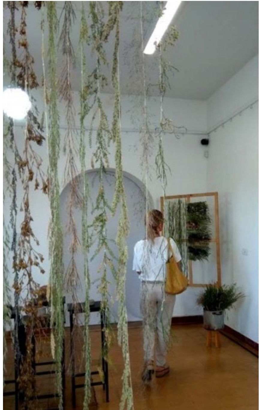
Pieza N°3 - Tejido en telar con pastos