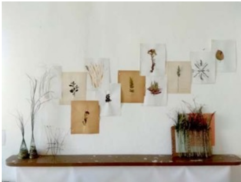
Tejidos y páginas del cuaderno